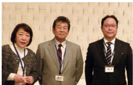
親睦ロータリー家族委員会スタッフ