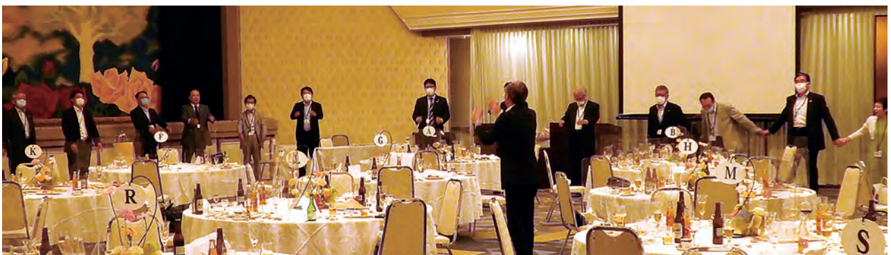
※クラブ会報は会員の敬称は略させていただきます