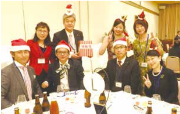
親睦ロータリー 家族委員会